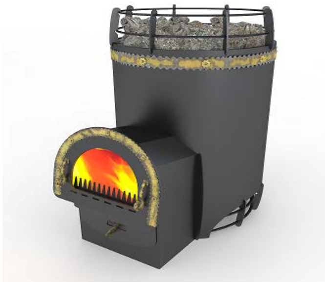
рис. 1 Вольга-1,2