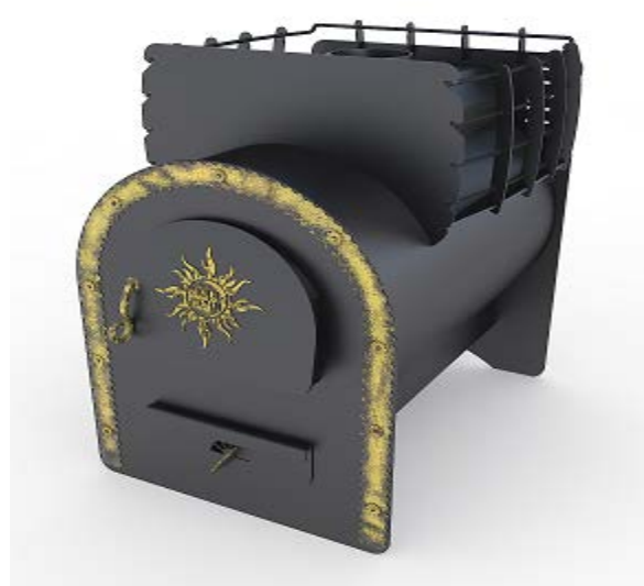
рис. 2 Забава