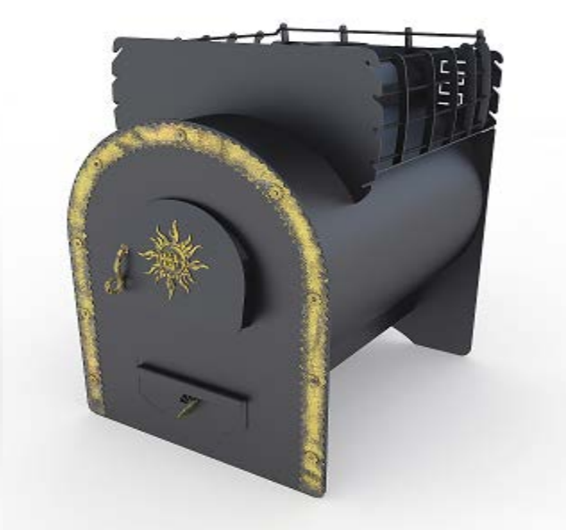
рис. 6 Добрыня