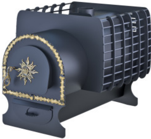
рис. 7 Святогор