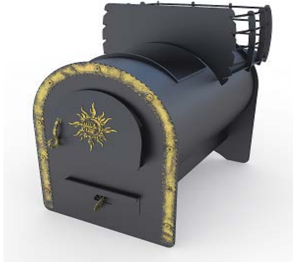
рис. 4 Любаня