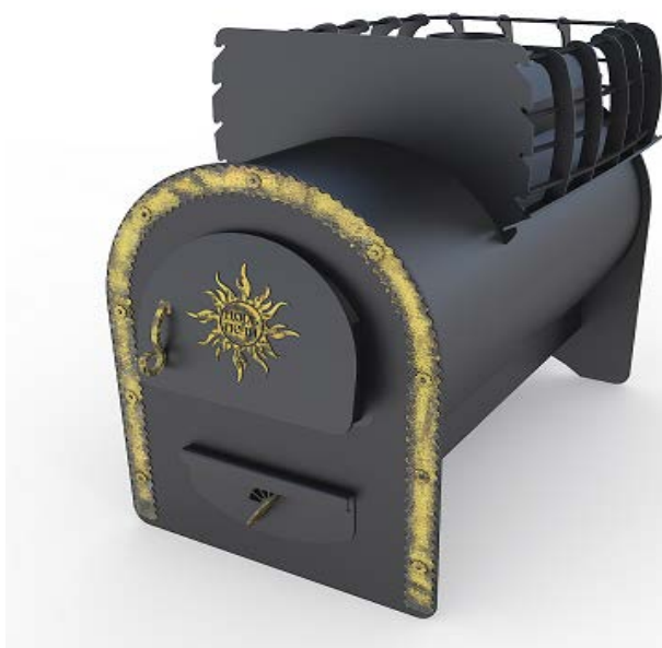
рис. 5 Горыня