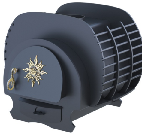
рис. 8 Малуша